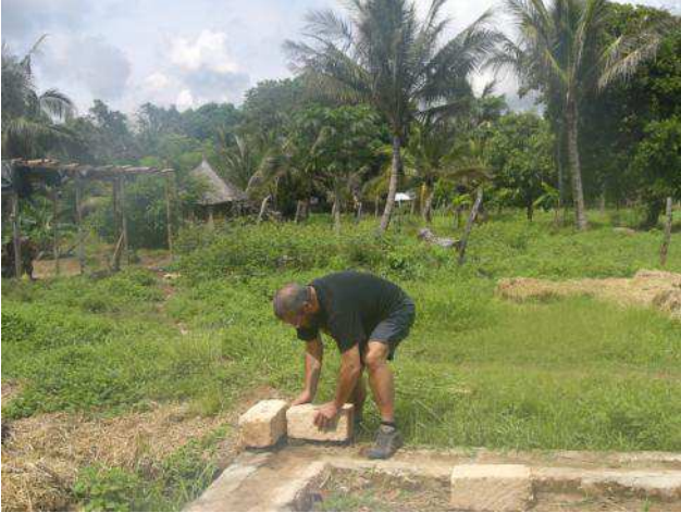
la prima pietra

tanti gli sforzi, e pure le delusioni, ma a fine 2011 siamo in grado di metterci qualcosa (poco) su quel terreno