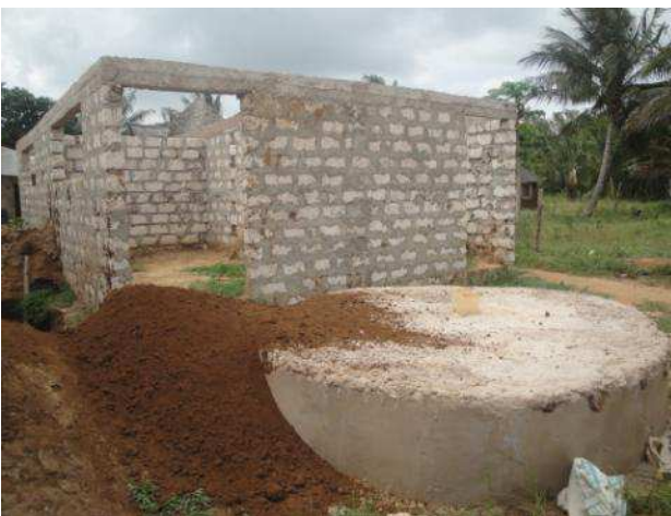
i servizi e la mega fossa biologica