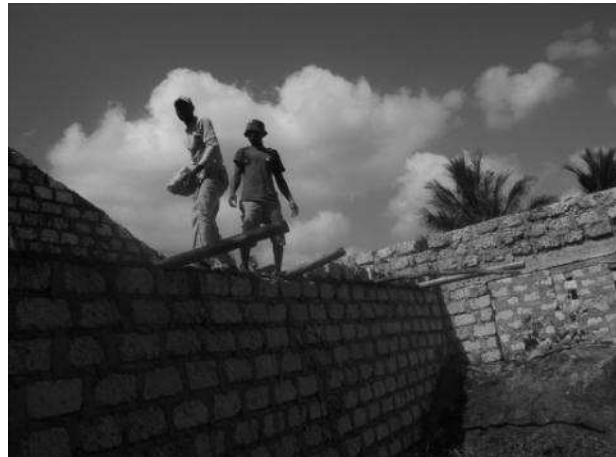
men at work