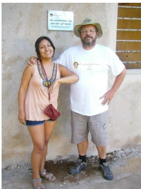
prima di ripartire si festeggia anche se..... è solo quasi finita.....