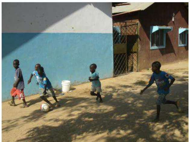
tutto qui per giocare