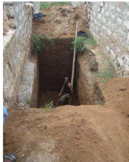
le fosse settiche