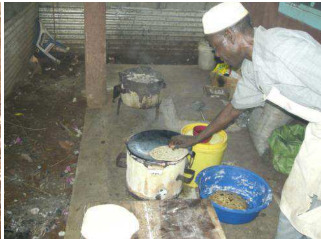
qui, e così, si cucina