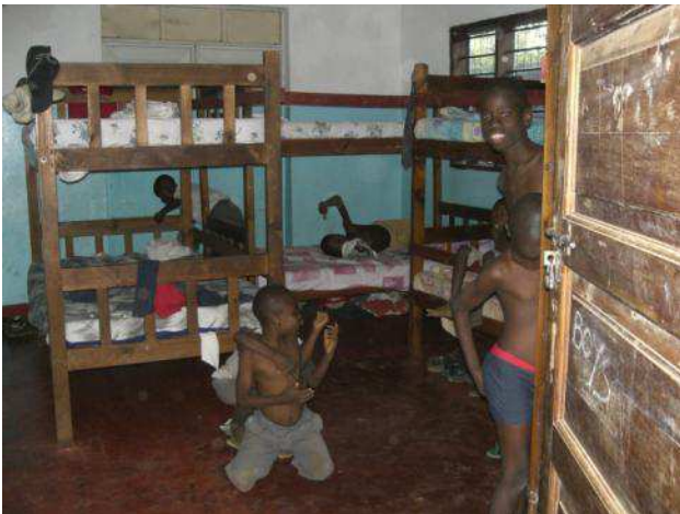
in 3 piccoli locali si dorme (in 40 su 9 i letti a castello)