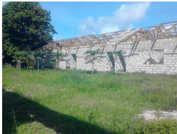
dormitori con struttura sostegno tetto