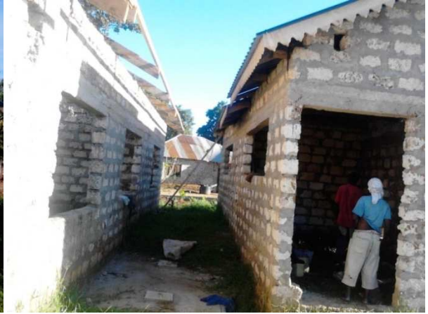
fosse settiche terminate