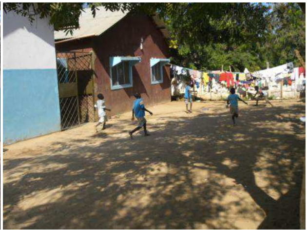
40 bambini in due piccole costruzioni (non si arriva a 150 mq) per 250 Euro/mese