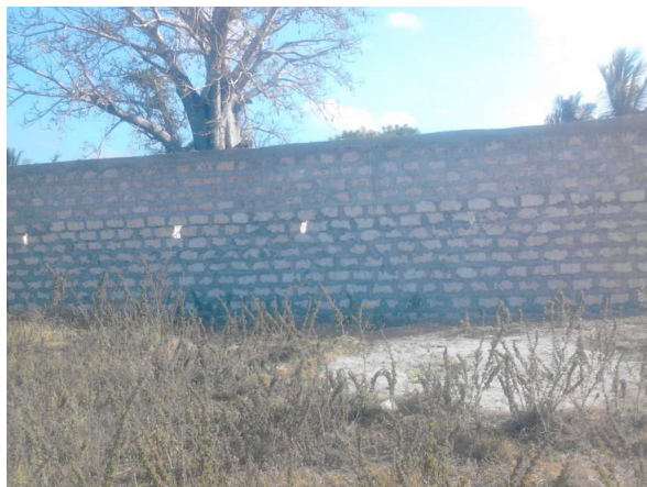
refettorio/cucina con muri al tetto

Maggio 2012: si accelera: muri e tetti crescono