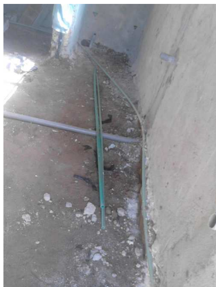
particolari della base per i pavimenti e degli impianti idraulici