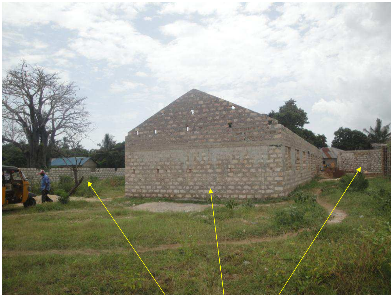
i muri: del refettorio, dei dormitori, dei servizi

dicembre 2012: niente male (per chi si accontenta): così ad 1 anno dalla prima pietra