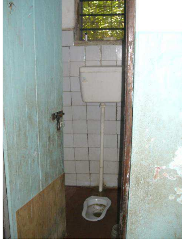
uno dei 4 servizi

a fine 2010 ci possiamo permettere un terreno nostro