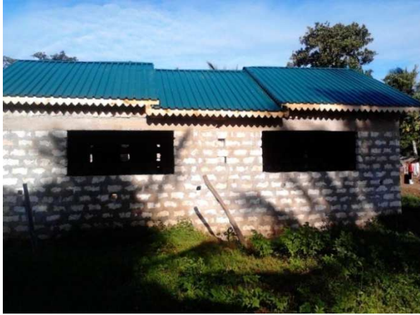
servizi con tetto